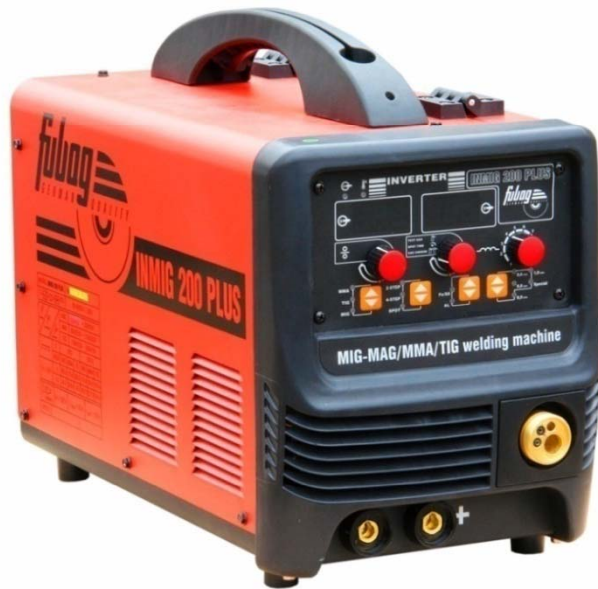
INMIG 200 PLUS